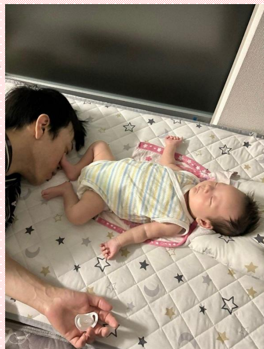
令和6年度最優秀賞「真夜中の攻防の末…」

家事・育児を楽しむパパ・ママや おじいちゃん・おばあちゃんと、お子さん やお孫さん(小学6年生まで)と一緒に 写る写真 ※応募者は市内在住・在勤・在学の方。 被写体の方は市外在住でも応募可。