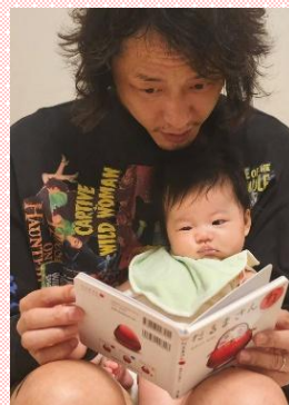
令和6年度優秀賞 2作品