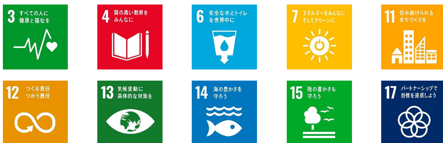
本計画に関連するSDGsの10の目標

みどりのまちづくりにおいても、SDGsの考え方を踏まえ、経済・社会・環境の三側面における持続可能な取組を推進し、10の目標の達成に寄与します。