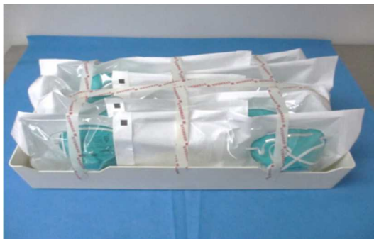
図 1：ロード用の N95 マスクの包装とトレイへの積載例