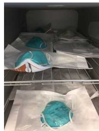
図 2：ロード用の N95 マスクの包装と棚への積載例