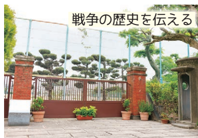
戦争の歴史を伝える

明治42年から昭和20年までの36年間、高槻城跡に駐屯していた工兵第四連隊が使用していた営門と哨兵所跡。営門はレンガ造り、哨兵所はコンクリート造りで当時の姿を残す貴重な建造物。戦争の歴史を今に伝えている。