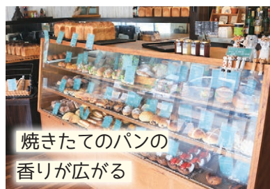
焼きたてのパンの香りが広がる