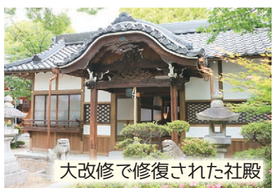
大改修で修復された社殿

高槻城三の丸跡にある野見神社の境内に建つ。幕末までの約220年間、13代にわたって高槻藩を治めた永井家の初代である直清（なおきよ）が神として祭られている。社殿は、近年の地震や台風で大きな被害を受けたが、令和の大改修で輝きを取り戻した。