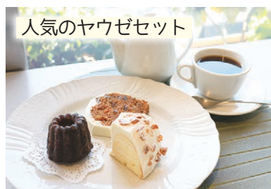
人気のヤウゼセット

スペシャルティコーヒーとケーキが楽しめるカフェ。コーヒーは、世界各国の農園から厳選した豆を季節に合わせてブレンド。注文を受けてから豆をひき、最高の状態で提供しているそう。そんなコーヒーに合わせるケーキは、店内で手作り。ヨーロッパの伝統菓子などが日替わりで味わえる。