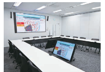
災害対策本部会議室