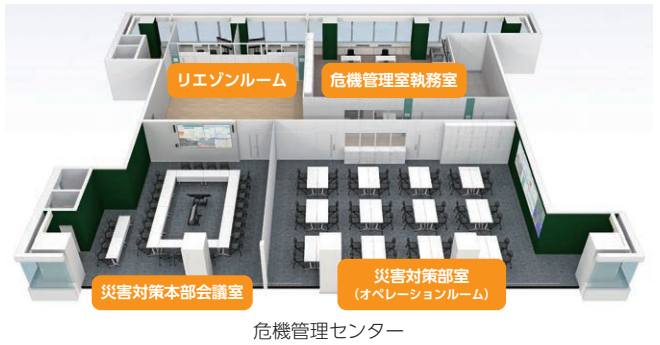
危機管理センター

対象 小学生以上 ※1人から受講可 日時 7/6(月)～ 場所 危機管理センター（総合センター6階） 料金 無料 申込 前々月の15日から HP 窓 ☎ F で (7～9月利用分は7/1(水)から)