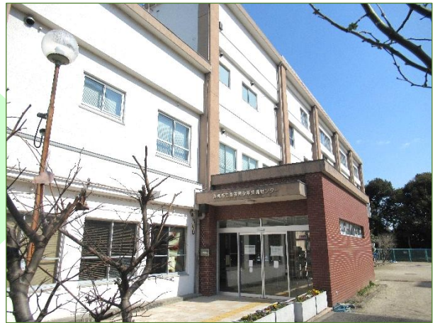
富田青少年交流センターの外観と案内図