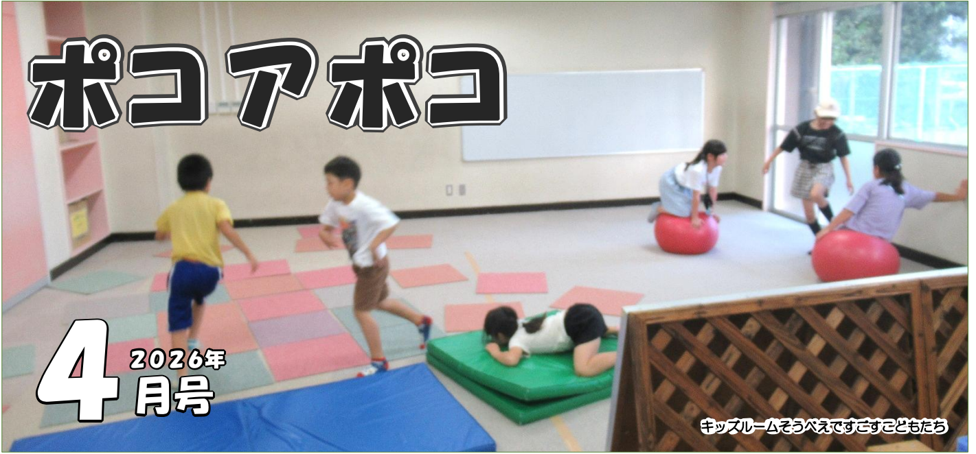
キッズルームそうべえですぐすこどもたち

こんにちは！ポコアポコは富田青少年交流センターの講座や、キッズルームそうべえのイベントなどを発信する情報誌です。新年度が始まり、新学年になった子どもたち、新しく入学した子どもたちに会えることを心待ちにしています。今年度も色々な講座やイベント情報を発信していくために準備を進めていますので、楽しみにしてくださいね。