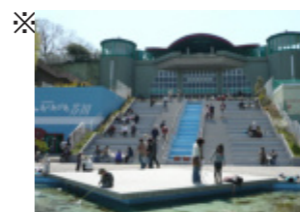
高槻市立自然博物館（あくあびあ芥川）

高槻市立自然博物館（あくあびあ芥川）は、高槻の自然がわかるみんなの博物館です。館内には、芥川の魚・カメ・カニなどの水族館や、鳥・哺乳類・昆虫類・化石・岩石などの標本展示室があります。生き物の質問や相談などがありましたら、気軽にお問い合わせください。