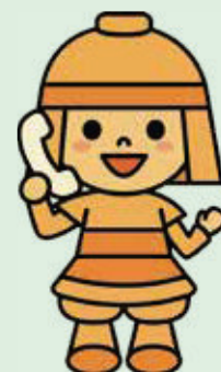
ほにたん 高槻市 マスコットキャラクター