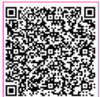
電子申込用 二次元コード