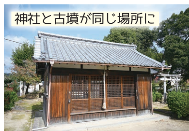
神社と古墳が同じ場所に