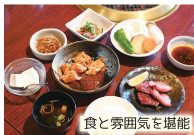
食と雰囲気を楽しめる