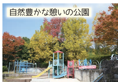
自然豊かな憩いの公園

豊かな自然を感じられる公園で、遊具や広場、池のエリアが設けられていて、散策もお勧め。広場外周の遊歩道には健康遊具や日時計、ベンチも設置され、憩いの空間になっている。