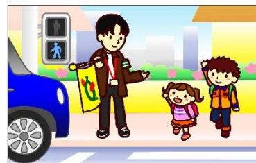
交通指導のイメージ▼