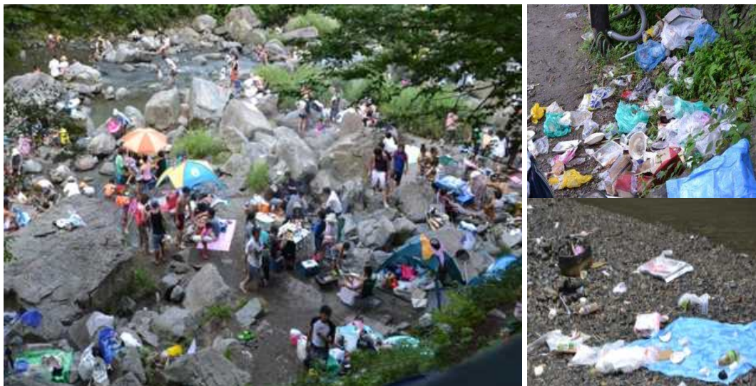
条例制定前の様子