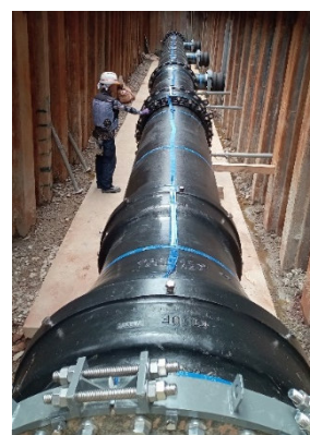
水道管更新 (老朽化・耐震化対策)