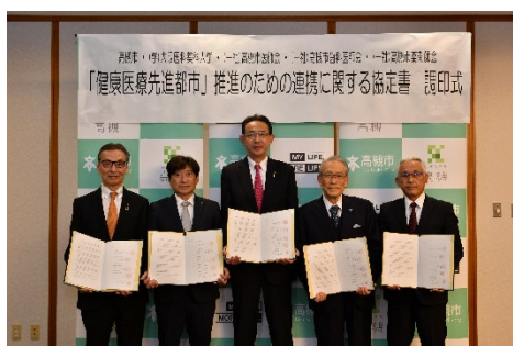
「健康医療先進都市」推進のための 連携協定