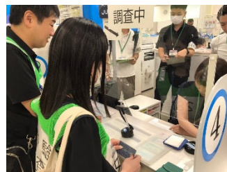
業務改善に向けた窓口体験調査