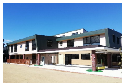
認定こども園化の推進 （富田認定こども園新園舎）