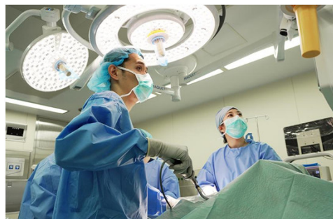
全国に誇るべき医療体制が整うまち