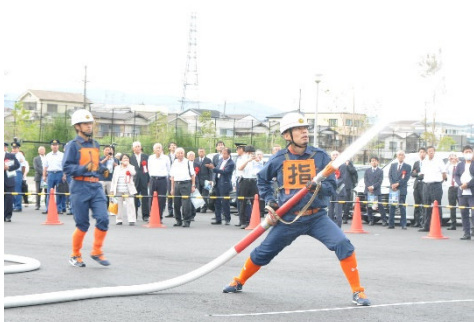
消防団の訓練の様子