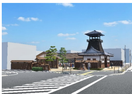
高槻城公園（北エリア大手地区）整備イメージ