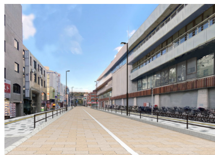
高槻駅前線の整備イメージ