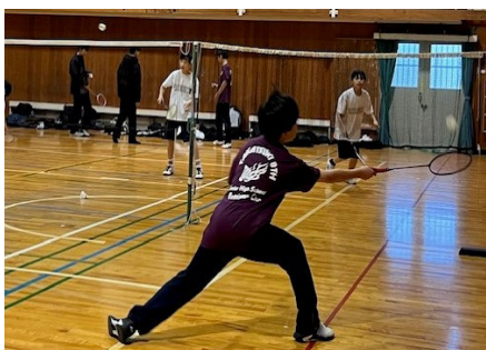
部活動の様子 （休日の活動を地域クラブへ移行）