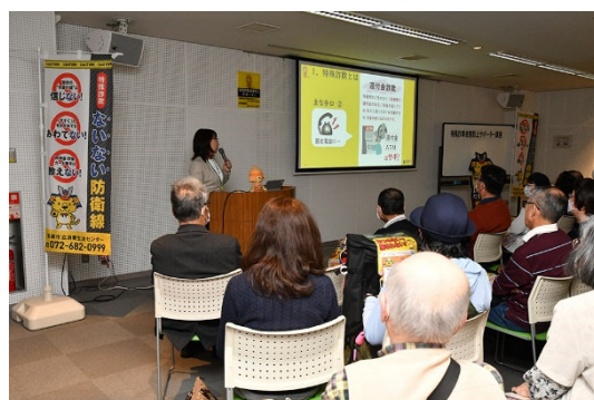
特殊詐欺被害防止サポーター講座の様子

（特殊詐欺被害防止サポーター制度の取組を推進、 拡 詐欺電話対策機器の無料貸出数を増加）