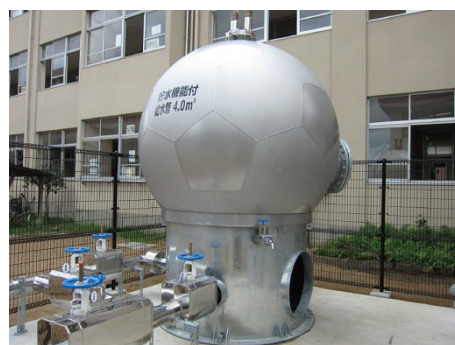
貯水機能付給水管（イメージ）