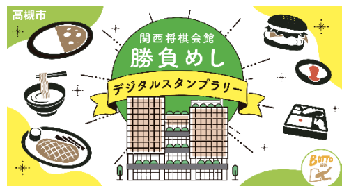
市内飲食店と連携したにぎわいづくり （「BOTTOたかつき」の取組）