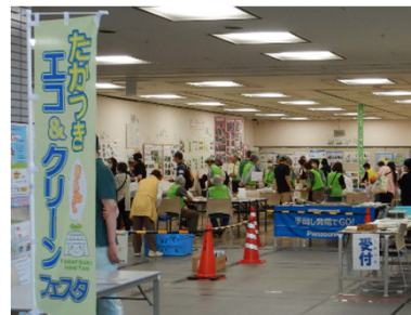
エコ&クリーンフェスタの様子