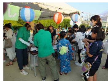
地区コミュニティの夏まつりの様子