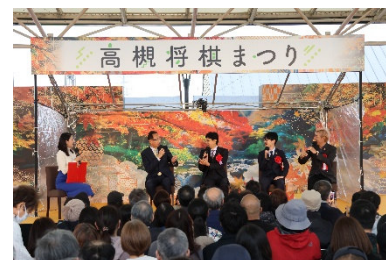
将棋まつりの様子