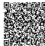
窓口受付予約 二次元コード