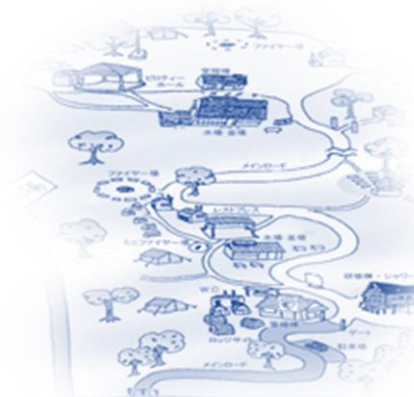
摂津峡青少年キャンプ場