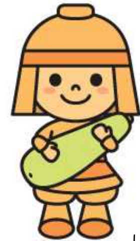
しろうりはにたん

高槻市には美味しい農産物が いっぱい！市内の朝市・直売所 を巡って、あなたのお気に入りを 探してみませんか？