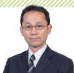
井上慶太 九段 (日本将棋連盟常務理事)