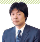
藤井 猛 九段