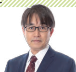
羽生善治 九段 (日本将棋連盟会長)