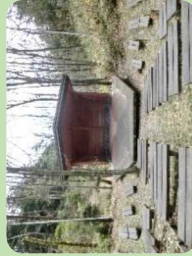
野外ステージ (さまざまな活動をお楽しみください)