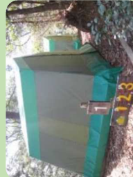
常設テント 60名 (6名×10張)