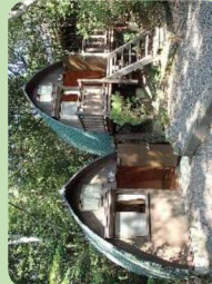
ロッジ 54名 (6名×9棟)