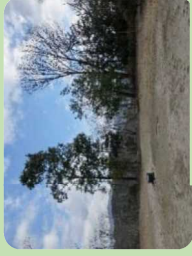
山上広場 (施設最大の広場です)