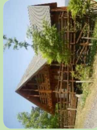
研修棟 (研修や会議、クラフト等にご利用ください)