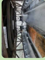
自炊場 80名 (第2キャンプ場)