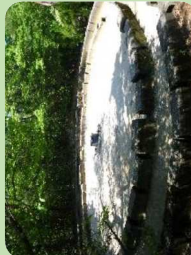
キャンプファイヤー場 (第1キャンプ場)