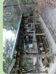
自炊場 120名 (第1キャンプ場3ヶ所)