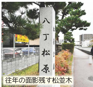
往年の面影残す松並木

八丁松原は江戸時代、高槻城下の京口から西国街道に至る八丁（約900m）の間に続いた松並木のこと。当時をしのばせる老松やきれいな草花が道行く人を楽しませてくれる。