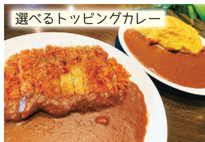
選べるトッピングカレー

フルーティーな甘さの後にピリッと来る、程良い辛さが癖になるシンプルなカレー。さまざまなトッピングの中から好きなものをカスタマイズして、その日の気分で自分だけのカレーを楽しんでみては。