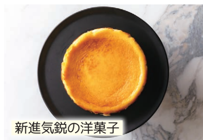
新進気鋭の洋菓子

八丁畷の交差点すぐにある小さなチーズケーキ店。外観も内装もおしゃれでドキドキしながらドアを開けるとチーズの良い香りで気持ちが高まる。看板メニューのとろ生チーズケーキは中はしっとり濃厚で、でもしつこくなく上品な味。