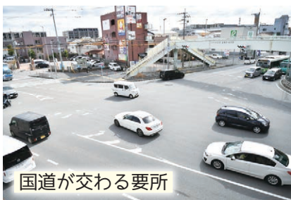
国道が交わる要所

国道170号と171号が重なる、交通の要所となっている交差点。この上をまたぐ陸橋は、車が絶え間なく行き交う様子を撮影できる隠れスポット。