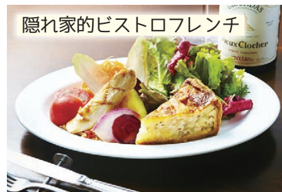
隠れ家的ビストロフレンチ

フランスの大衆食堂をイメージし、家庭的で素敵な雰囲気を楽しむことができるフランス料理店。閑静な住宅街の一角だが、絶品料理を堪能しに来るリピーターも多数。