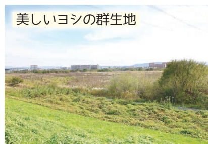
美しいヨシの群生地

地元の鎮守として信仰を集めている神社。広い境内は深い緑であふれ、緑の空間として市民の癒しの場に。市の樹林保護地区の指定も受けていて、大きなエノキやクスノキの圧倒的な存在感に息をのむ。