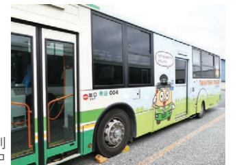
ばすおとはにたんの特別 ラッピングバスが運行中