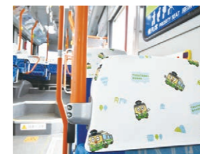
車内にもばすおが いっぱい

70周年を記念して、全ての車両が記念ロゴの入ったフロントマスクを付けて走っています。その中には70周年を記念した特別デザインのバスも運行中。内装にもこだわっています。ばすおが目印ですよ。