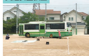
毎年春秋に開催。バスの内輪差を 実演して交通安全を指導