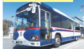
人口急増期のバスカラーを再現