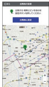
バス停が分からなくても 地図から検索

市営バスホームページでは時刻表やバスが何分で来るか、遅れが発生しているかなどを検索できます。バス停が分からなくても地図から近くのバス停を探すこともできます。