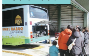
車庫やバス車体の洗車など普段は 見られない風景を見学