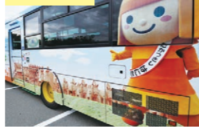
車外も車内もはにたんいっぱい