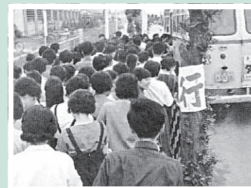
朝の通勤ラッシュ

大規模な住宅開発や大型団地の進出で人口が10年で20万人急増。合わせてバスの利用者も増加し、通勤通学の時間帯は長蛇の列でした。