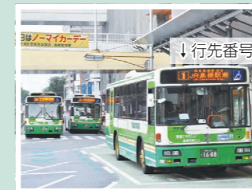
鉄道駅行きのバス

行先番号とはバスを案内する上で区別するために付番されている番号です。市営バスでは鉄道駅に向かうものは全て番号が統一されています。