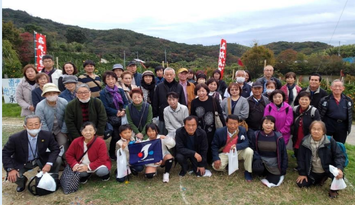
みかん狩り 平岡農園