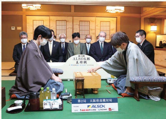
前回の王将戦の様子