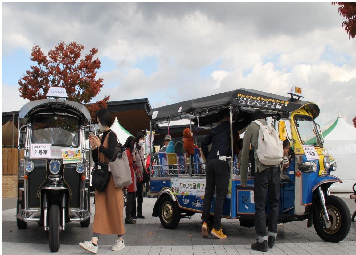
安満遺跡公園で待機するトゥクトゥク