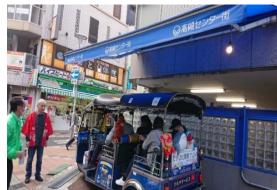
センター街商店街でのトゥクトゥク