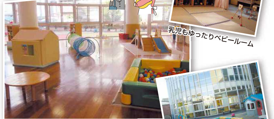
乳児もゆったりベビールーム

広々としたスペースにはボールプールや滑り台もあります。 保育士常駐なので子育て相談もでき、 親子で安心して過ごせます。