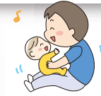
晴れた日は外遊びも