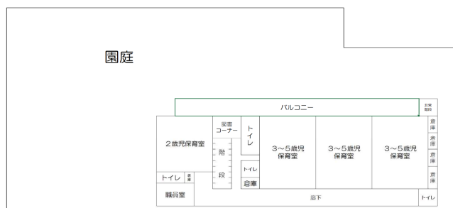
芥川認定こども園 2階