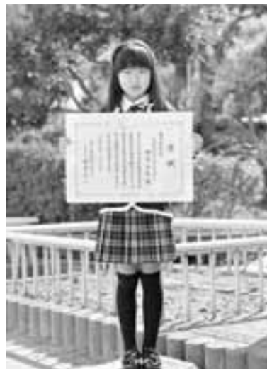
手紙作文コンクール