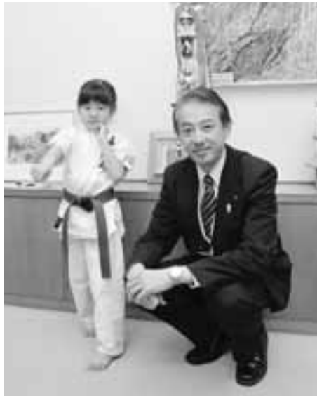
全日本空手大会(幼児女子の部)