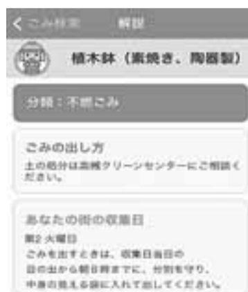
ごみの分別、出し方

分別、地域ごとの収集日の検索ができますので、ご利用ください。 アプリや市ホームページを使って、ごみの正しい分別にご協力をお願いします。