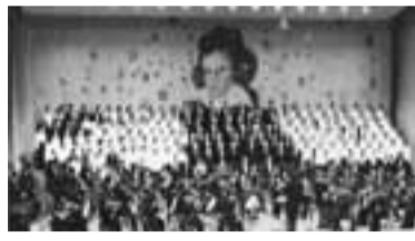
命輝け高槻第九コンサートの会

11月30日(土)の催し いずれも会場は生涯学習センター2階多目的ホール(抽選会は同センター1階ロビー、フリーマーケットは市役所本館東・南側)。当日直接、会場へ。 【フリーマーケット】福祉展の市 午前10時～午後3時 【映画会】逃げ遅れる人々(午前11時～午後0時20分。無料)