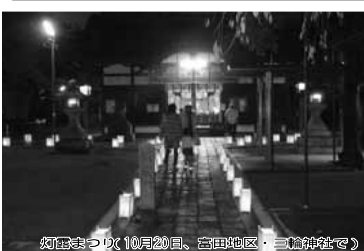
灯籠まつり(10月20日、富田地区・三輪神社で)