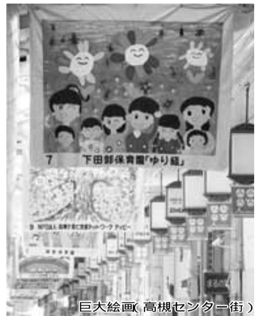
巨大絵画(高槻センター街)

赤大路小学校で11月1日、関西大学の学生が講師を務め、ロボットを使って算数の授業を行いました。授業のテーマは「割合」。数字が書かれた5x7マスシートを並べ、掛け算と割り算を行いながら目標値になるようゴールを目指します。授業を受けた6年生の児童らはロボットを使って、グループで話し合いながら取り組み、「計算が難しかったけど、みんなで協力して正解にたどり着けよかったです」と、楽しく学びました。