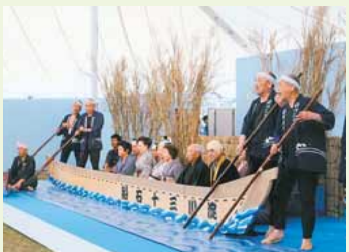
ステージには船頭と船客が登場。伏見を出発して八軒家に着くまでを唄と掛け合いで表現する

淀川三十石船唄は、大阪を代表する民謡の一つです。私の生まれ育った高槻市大塚地区では昔から唄われてきました。唄からは、船頭や乗客が眺めていた当時の情景を思い浮かべることが出来ます。私は情緒あふれる唄そのものがとても魅力的で好きです。残念ながら歌詞に描かれている情景は今に残っていませんが、だからこそ唄を保存し、後世に残さなければなりません。唄い継ぐことで地域の歴史や文化を次世代へとつなげていきたいです。