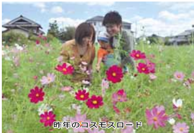
昨年のコスモスロード