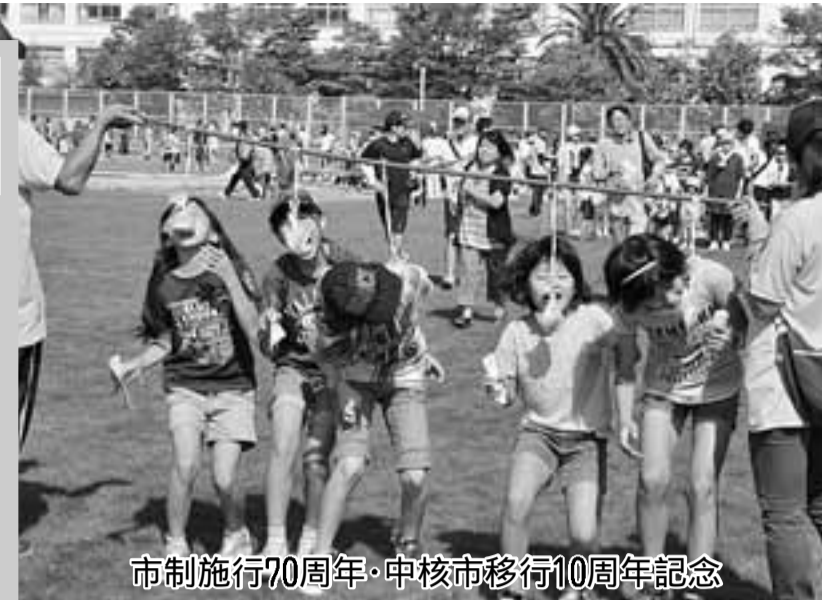
市制施行70周年・中核市移行10周年記念

市制施行70周年・中核市移行10周年記念「市民スポーツ祭」を10月14日(祝)総合スポーツセンターで開催します。 種目は親子で楽しめるキッズダンスやトランポリン、ふわふわバッティングゲームなど、体を動かすコーナーのほか、健康チェックやAEDの使い方体験するコーナーなどもあり、子どもから高齢者まで楽しめる35以上の種目があります(左表)。