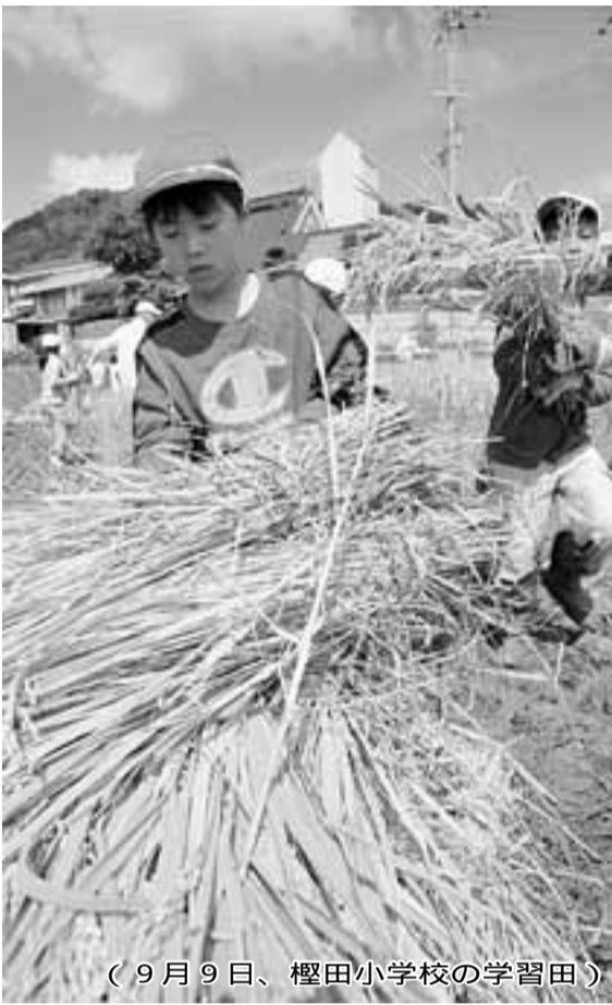
(9月9日、櫻田小学校の学習田)