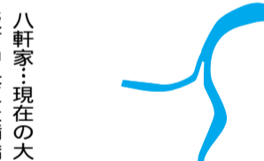
八軒家：現在の大阪市中央区天満橋