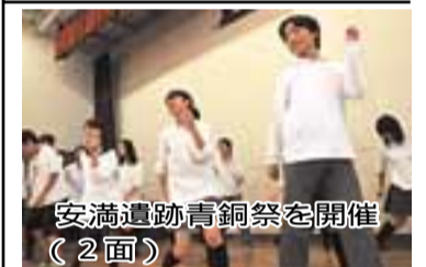
安満遺跡青銅祭を開催(2面)