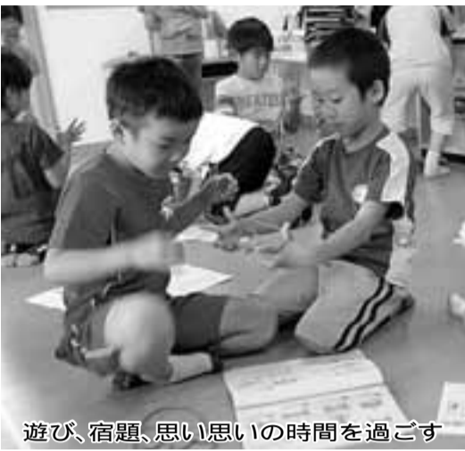
遊び、宿題、思い思いの時間を過ごす

学童保育室の入室希望は随時受け付けています。詳しくは子ども育成課へお問い合わせください。