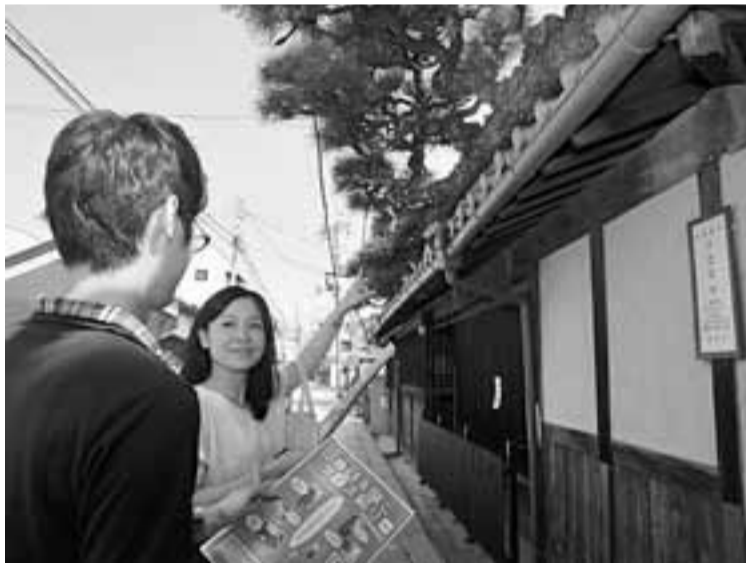
クイズの一つ、屋根をつたうクロマツ

た卑弥呼の鏡レプリカなどの景品を進呈。クイズとその舞台となる場所を示した地図は、都市づくり推進課市立各図書館などで配布しています。