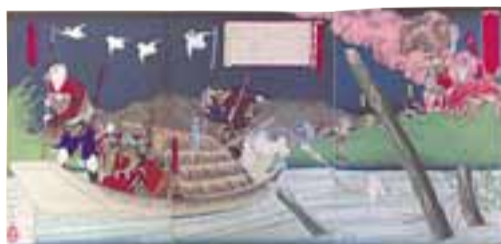
徳川秀忠と唐崎村平六の故事を伝える錦絵(しろあと歴史館所蔵)

柱本が発祥の「くらわんか舟」は、三十石船の乗客相手に餅や酒などの飲食物を売っていた小さな茶舟(商舟)です。客相手に聞わらず乱暴な言葉で「くらわんか、くらわんか」と呼び掛けていました。単調な船旅の退屈を紛らわしてくれると人気があり、船唄の中でも、掛け合いが表現されています。 柱本の茶舟が淀川で営業できたのは、1615年の大坂夏の陣で徳川軍のために、茶舟で高槻城から米を運送させたことの褒賞であるといわれています。また俗説ですが戦いの中で淀川に落ちた徳川秀忠を唐崎村の平六が助け、その恩賞として茶舟の船頭は悪口で商売してもとがめられないともいわれています。