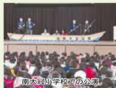
南大冠小学校での公演

大塚保存会ができたのは父の代です。父は臨時の船頭だった祖父から唄を習いました。当時はすでに三十石船は廃れてしまいましたが、渡し舟などの船頭の仕事はまだあり、大塚地区では仕事している人が多かったようです。時代とともに船は姿を消しましたが父は唄だけは守り継ぎたい」と船頭衆の子孫たちと一緒に保存会を結成しました。自宅に保存会のメンバーに熱心に唄の指導をしている父を見て、私も参加しようと決めました。父が唄い方で大事にしていたのは、なまりでした。