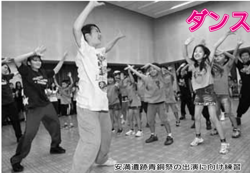
安満遺跡青銅祭の出演に向け練習

市は10月13日(日)、市制施行70周年・中核市移行10周年の記念セレモニーを、高槻現代劇場で開催します。第一部では主に市政功労者を対象とした記念式典を、第二部では、音楽とダンスによる市民協働イベント「安満遺跡青銅祭」を行います。