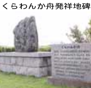
くらわんか舟発祥地碑

【唐崎】三島江と合わせて、富田の外港といわれ、周辺地域の物資が集まった港。幕府の許可を得た過書船の荷船間屋もありました。船唄の12番にあるように、唐崎に弥右衛門屋敷という地名があり、豪農がいたといわれています 【三島江】三十石船の船着場であり、対岸の出口村への渡し舟も出ていました。当時灯台の役割を果たしていた妙見灯籠が三島江の堤防沿いに現存しています。ここから市北部にある神峯山寺へつながる道もあり、参詣客で賑わいました 【柱本】くらわんか舟発祥の地といわれ、柱本煮売茶舟の拠点でした