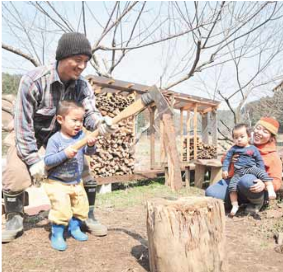
自然豊かな榎田地区に移住してきた家族