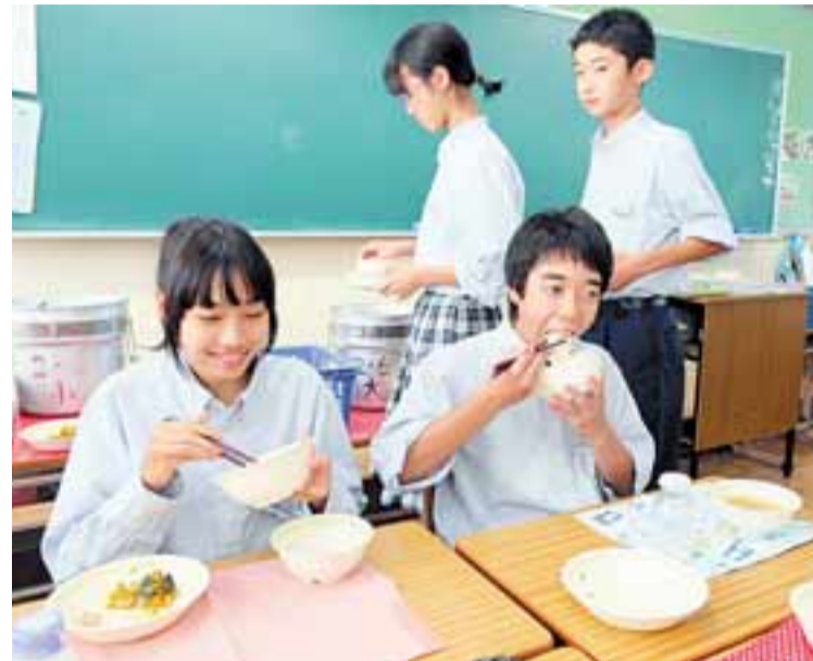
栄養バランスの取れた昼食を提供し、健全な成長と楽しい食習慣の定着を図ります