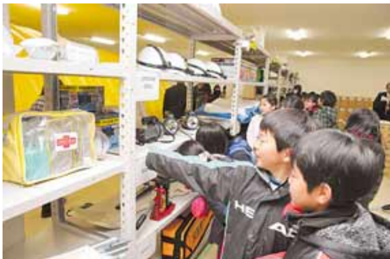
防災副読本の作成・配布など、小・中学校での実践的な防災教育を充実していきます