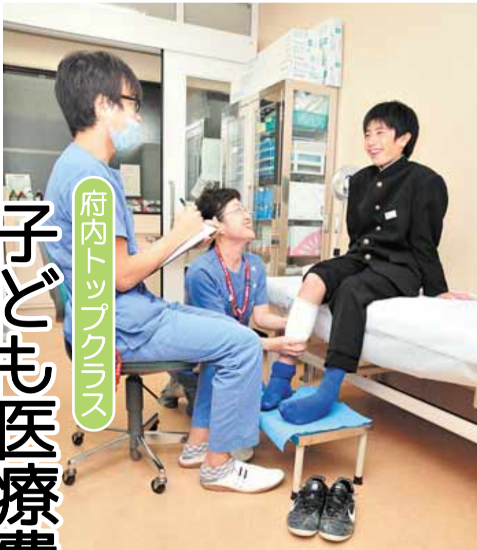
府内トップクラス