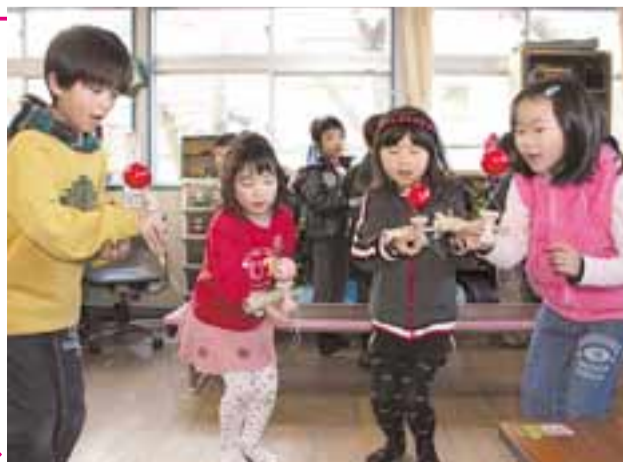
学童保育室は「家庭に代わる毎日の生活の場」。子どもたちの安全を守り、安心して通わせるよう整備を進めます