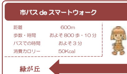
イメージは変更する場合があります