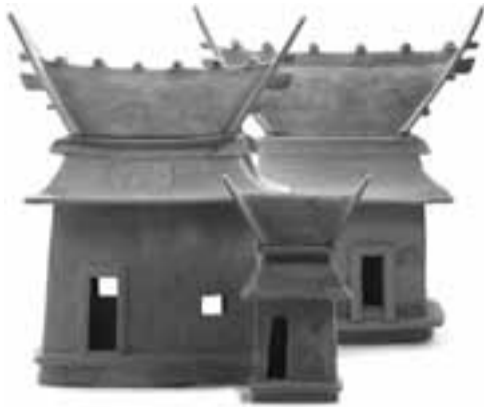
今城塚古墳から出土の家形埴輪

大王墓・今城塚古墳から出土した大小20棟以上の家、貴重な扉がある門や塀のハニワをテーマに、未公開資料を含めた調査研究の成果を紹介し、また、下欄のトピック展示を同時開催します。