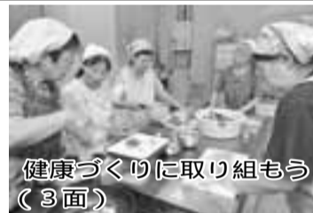
健康づくりに取り組もう (3面)