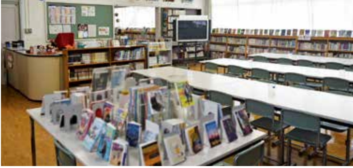
▲児童生徒の読書環境の充実が期待される学校図書館