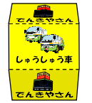
黄サイコロ 白サイコロで「4家電チャンス!」が出た時だけ使う