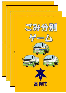
ごみカード 【裏向き】 ①