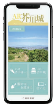
専用アプリ「AR芥川城」

国史跡に指定された芥川城跡に関する特別講座の開催や御城印・武将印の発行、ARアプリの活用などで、市民の関心を高め、「歴史のまち高槻」の魅力を全国に発信します。