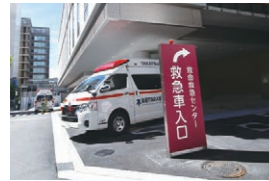
救命救急センター (大阪医科薬科大学病院)

4月に新施設へ移転した高槻島本夜間休日応急診療所では、引き続き初期救急医療体制を確保します。