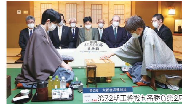
第2局 大阪府高槻対局 第72期王将戦七番勝負第2局

将棋のタイトル戦の開催や、各種将棋大会、将棋まつり、全国将棋サミットの開催などで、「将棋のまち高槻」を全国へ発信します。また、小学1年生に高槻産木材で製作した将棋駒を配布するなど、将棋文化の裾野拡大に努めます。