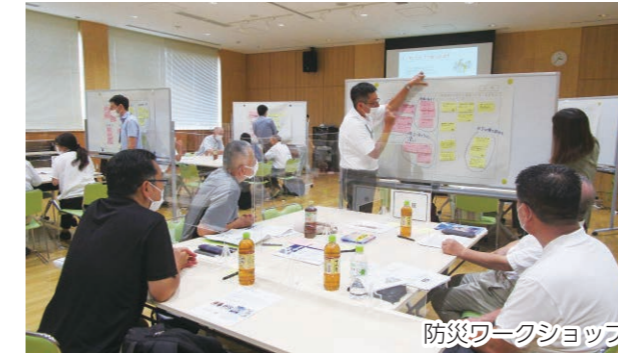
防災ワークショップ

自助・共助力のさらなる向上に向けて、市民防災協議会の活動を支援。また同協議会と協働で、各地区の防災活動のサポートや人材の育成など、災害に強いまちづくり・人づくりを推進します。