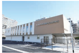
高槻島本夜間休日応急診療所