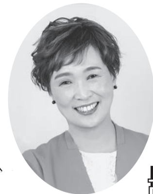
高槻市議会議員(2019年初当選)

市民力と政治をつなぐ 高槻市市民公益活動サポートセンター管理運営委員長(3期6年就任) もっと、子ども・若者・女性施策を!! NPO法人SEAN初代理事長(保育・人権教育の講師)