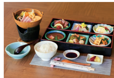
「花玉手箱重」は、和食ひと筋の料理長が、季節ごとに旬の素材をぎゅっと一つのお重に。

摂津峡の川沿いに面し、自然をたっぷりと感じながら宿泊、日帰り温泉を楽しめる旅館。屋食と温泉の満喫プランは、右で紹介した「花玉手箱重」と、キジ鍋か雲海鍋の「鍋膳」の2つのコースがあります。最近是将棋の王将戦が行われ、将棋ファンの間でも有名に。