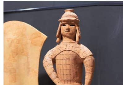
この武人のハニワは、高槻市のPRマスコットキャラクター・はにたんのモデル。