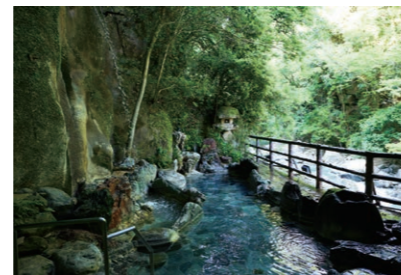
眺めがすばらしい露天風呂の泉質は、ヌルヌルの肌触りの重曹泉。他に大浴場も利用できます。