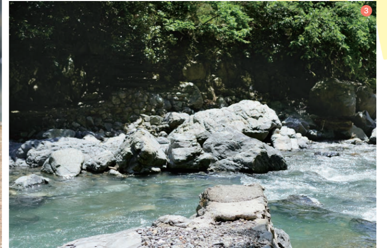
① “ザ・摂津峡”の景色が夫婦岩。②高さ10mほどの白滝。長山さんは、「近くには行者岩があり、昔はここで滝行をしたのでは？」。③「山水館と旧白滝茶屋の間には、かつて『小川亭』という茶屋があり、そこへ行く橋の面影が残ります」と長山さん。