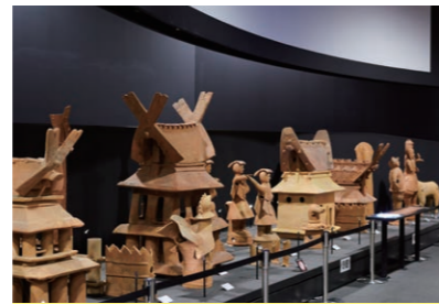
家、人、動物など、今城塚古墳で見つかった本物のハニワ群を展示しています。

継体大王の陵墓といわれる今城塚古墳に隣接。この古墳ができた時代はあらゆる種類がそろったハニワの全盛期とされ、館内にも多くのハニワが展示されています。夏期には、子どもたちを対象としたワークショップも開催。