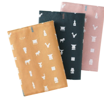
ハニワブックカバー

「摂津峡 花の里温泉 山水館」では、旅館のシンボルとなっている紅葉のドリンクを販売。葉を焙煎した「もみじ茶」とサイダーの「もゆるは」。