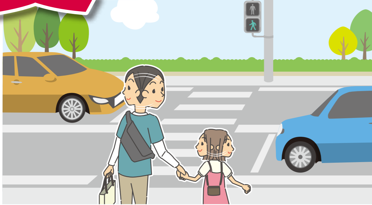
こどもの交通事故防止