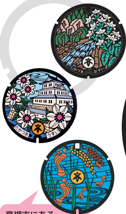
高槻市にある デザインマンホール

例えば…貴重な史跡（芥川城跡、高槻城跡、今城塚古墳など）、将棋のまち ※高槻市の概要・特徴については、高槻市ホームページ等をご覧ください。