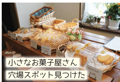
小さなお菓子屋さん 穴場スポット見つけた