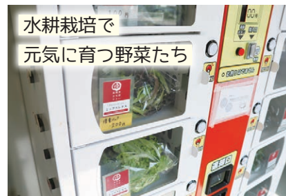
水耕栽培で 元気に育つ野菜たち