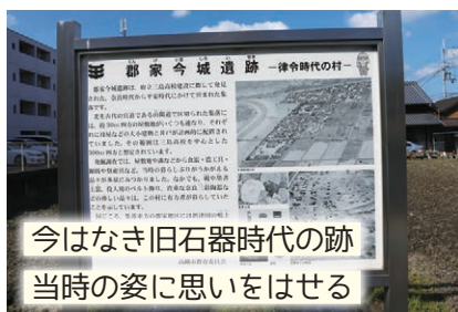
今はなき旧石器時代の跡 当時の姿に思いをはせる

この辺り一帯は約2万年前、樹林が広がっていて、旧石器時代のキャンプ地が何カ所も見つかっている。当時狩人たちが食物を求めて移動しながら生活していたと見られる。