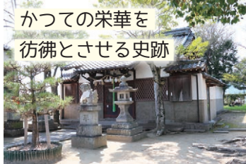
かつての栄華を 彷彿とさせる史跡

かつて奈良時代に、この地域には嶋上郡衙(嶋上郡の郡役所)があり、この場所には郡寺(芥川廃寺)があったとされる。やさしい木陰に誘われて、近くに来たときは一度立ち寄ってみて。