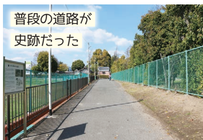
普段の道路が 史跡だった

素盞鳴尊神社の南側に位置するこの場所は、かつて芥川廃寺を囲む廊下があったとされる。この一帯が嶋上郡衙と一体となった歴史遺産として国史跡に指定されている。