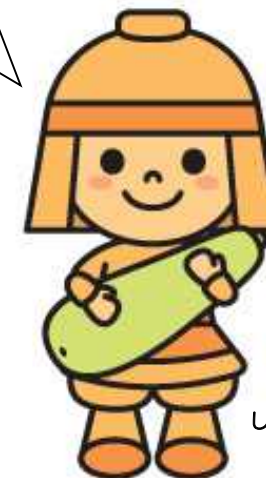
しろうりはにたん

高槻市には美味しい農産物がいっぱい！市内の朝市・直売所を巡って、あなたのお気に入りの探してみませんか？