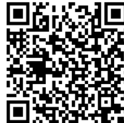
上記の二次元コードで簡易電子申込サービスにアクセスできます。

地域教育青少年課窓口：午前8時45分～午後5時15分（土・日・祝休日は受付不可）