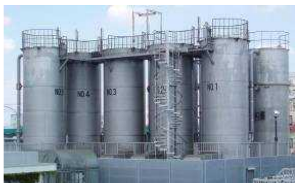
エアレーションタワー

* エアレーション … 水の中に含まれている有機塩素化合物を空気と接触させることにより取り除く方法