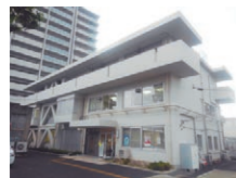
地域福祉会館(城西町4-6)

高槻中央地域包括支援センター／TEL676-9522 生活支援コーディネーター窓口／TEL676-9052 (社会福祉協議会内)