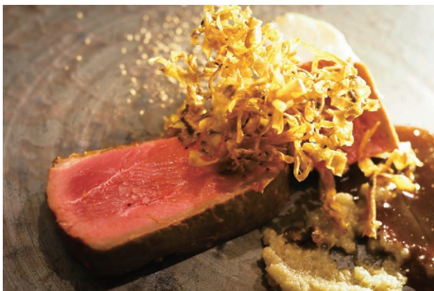
お箸で味わう本格フレンチ