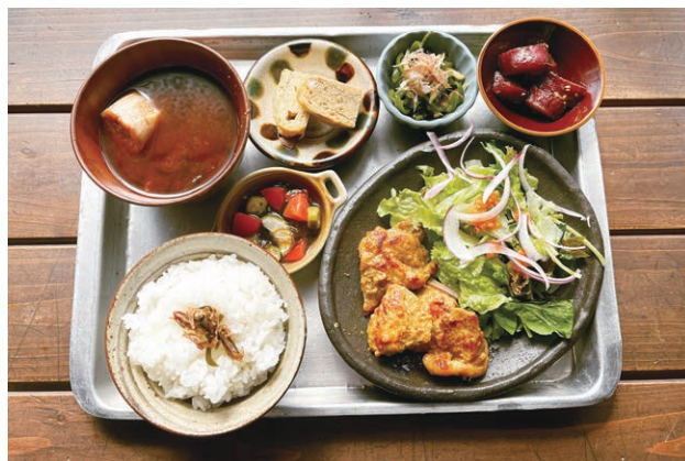
優しい味のおばんざいランチ