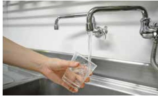
▲水道基本料金の4か月分無償化にも活用

議員 中小企業や農業も給付金の支給や補助率の上乗せ等、支援策を適切に進めてほしい。また、物価高騰は全ての市民がその影響を受けているため、地域の実情を把握して、税の公平性の観点から、公平に市民に行き渡る支援策にしてほしい。