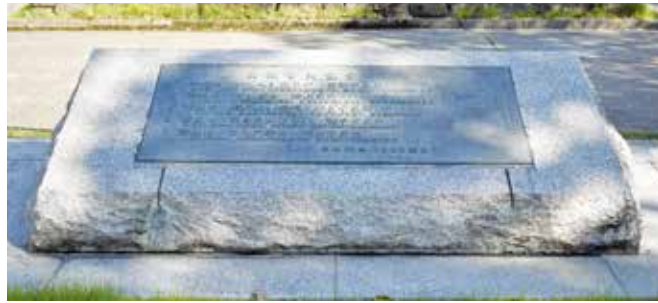
▲市民や自治会等の郷土・高槻への思いが込められた市民憲章碑

議員 式典を契機に、人口減少する本市のまちづくりを市民と一体となつて次の世代へと継承し、令和の時代にふさわしいまちづくりの取り組みをしてほしい。