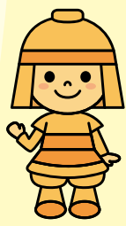
はにたん 高槻市 マスコットキャラクター