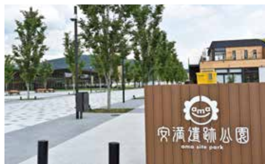
▲アクセスの向上が期待される安満遺跡公園

議員 イベントの開催時など、土・日・祝日を中心に多くの方が安満遺跡公園に来訪されていることから、市営バスの便数を増やしてほしい。