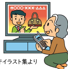
消費者庁イラスト集より

しかし、テレビショッピングでもトラブルになることがあります。ちょっとしたコツを知っておくとトラブルに巻き込まれにくくなります。