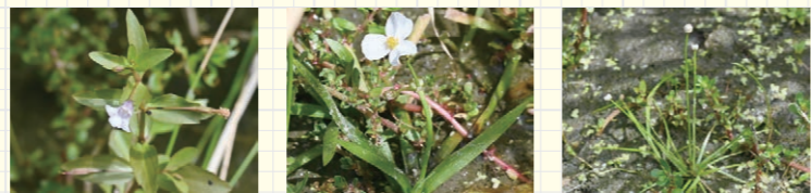
タケトアゼナ ウリカワ ホシクサ

西之川原橋から東に入ってすぐの細い舗装道を水路沿いに歩いて行くと、水路脇の田んぼの端に小さく可憐な水草がたくさん見られます。タケトアゼナ、ウリカワ、ホシクサを見つ