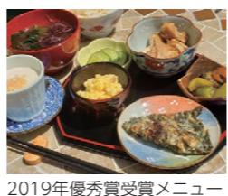
2019年優秀賞受賞メニュー

「応援団の店」を対象に、8月からヘルシーメニューのコンテストを開催します。お店のメニューの応募やホームページでの人気投票にぜひご参加ください。